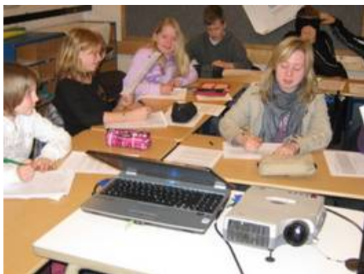
Bei der Auswertung