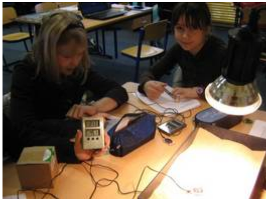
Versuche zum Thema Klima