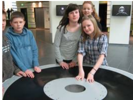
Im Klimahaus in Bremerhaven