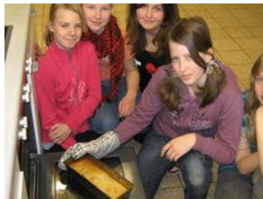
In der Küche