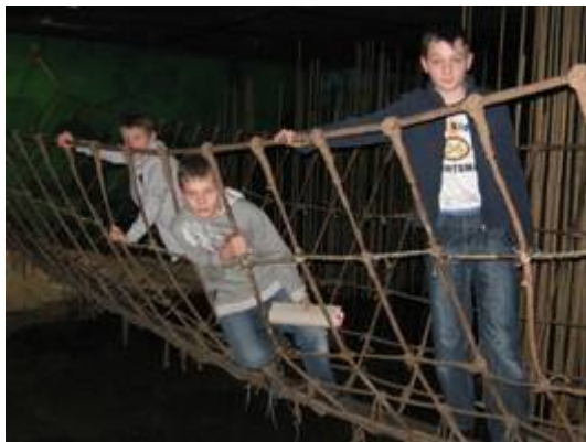
Im Klimahaus in Bremerhaven